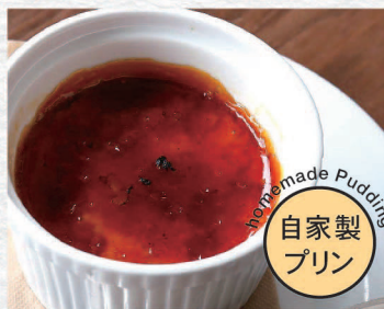
クレマカタラーナ ¥500 Crema Catalana