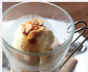
自家製 プリン カフェ アフォガート ¥500 Cafe Affogato