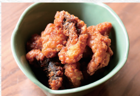
タコのから揚げ ¥590 Deep Fried Octopus