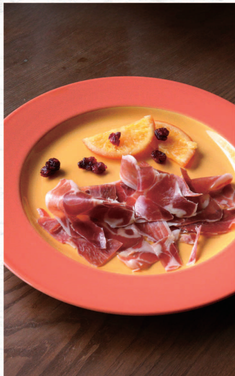
生ハムとドライフルーツ ¥1,200 Raw Ham and Dried Fruit