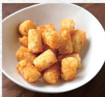
ころころハッシュドポテト(カレー風味) ¥380 Small Hash Browns (Curry Flavor)