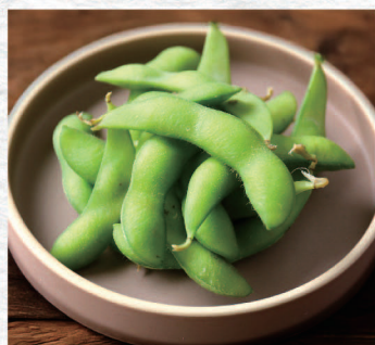
枝豆 ¥380 Green Soybeans