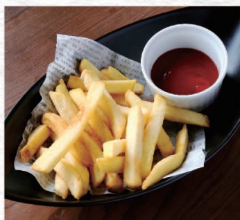
フライドポテト ¥460 French Fries