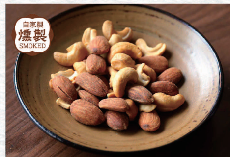
自家製 燻製 SMOKED 燻煙ナッツ ¥460 Smoked Nuts