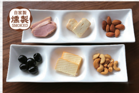
自家製 燻製 SMOKED 燻製6種盛り合せ ¥1,150 Assorted Smoked