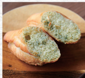
ガーリックトースト ¥480 Garlic Toast