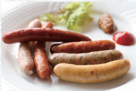
ソーセージ盛り合せ ¥1,200 Assorted Sausages