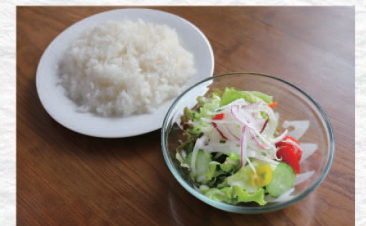
ライス・サラダセット ¥450 Rice & Salad Set