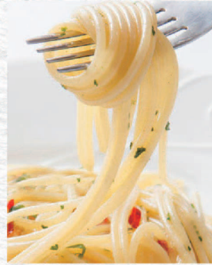
ペペロンチーノ ¥1,000 Peperoncino