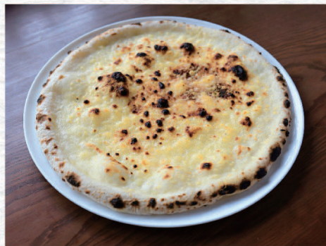
ビアンカ (オリーブオイル・グリュイエールチーズ) Bianca / Oliveoil, Gruyere ¥900