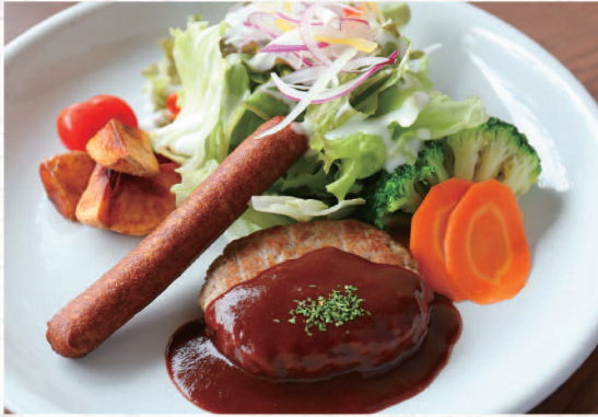
ベジタリアンプレート 大豆ミートのハンバーグ&ソーセージ ¥1,600 Vegetarian Plate Soy meat hamburger & soy meat sausage