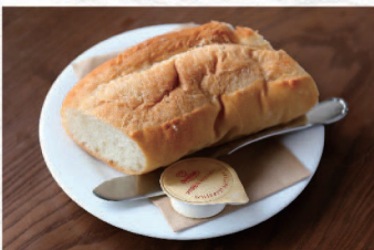
パン ¥300 Bread