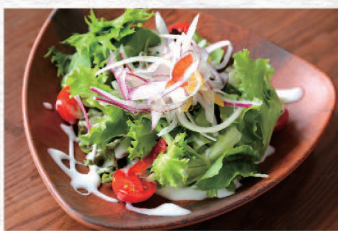
野菜サラダ ¥640 Garden Salad