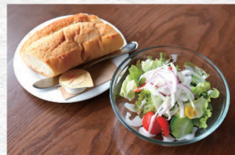
パン・サラダセット ¥450 Bread & Salad Set