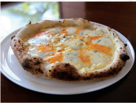
クワトロフォルマッジ (モッツアレラ・ゴルゴンゾーラ・レッドチェダー・グラナパダーノ) Quattro Formaggi Mozzarella, Gorgonzola, Red Cheddar, Grana Padano ¥2,450