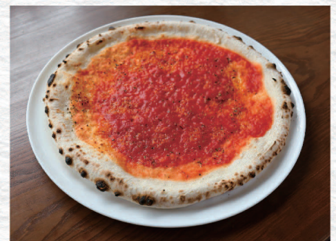
マリナーラ (トマト・ニンニク・オレガノ) Marinara / Tomato, Garlic, Oregano ¥1,200