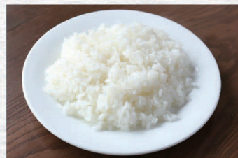
ライス ¥300 Rice