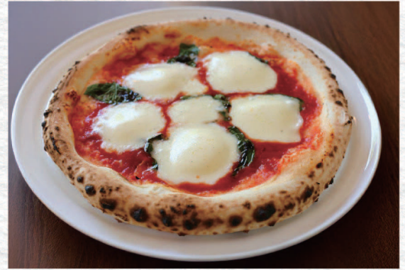
マルゲリータ (トマト・チーズ・バジル) ¥1,750 Margherita / Tomato, Cheese, Basil