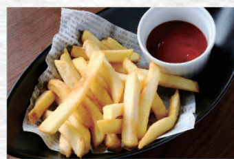
フライドポテト ¥460 French Fries